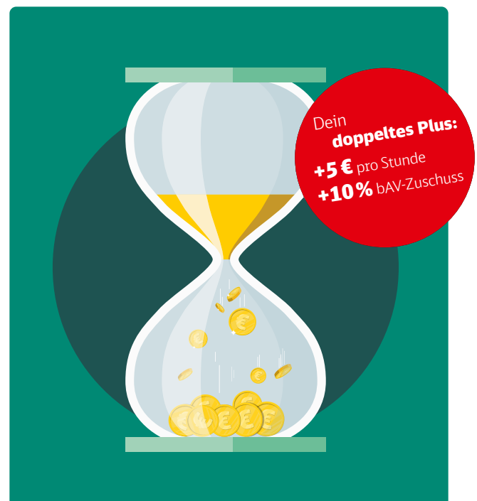
Das Rentenplus-Modell der DB

i Mehr über das Angebot unter db.de/rentenplus